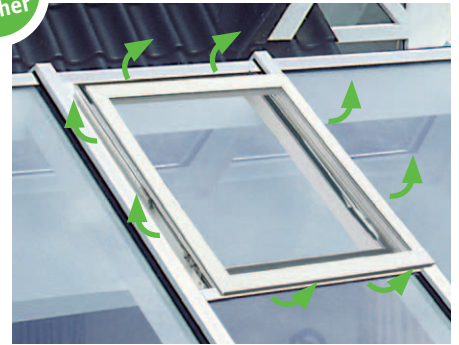
Hebestellung mit umlaufender Schlitzlüftung